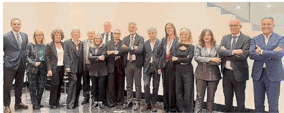
Protagonisti. Il Consiglio direttivo dell'Ordine dei Commercialisti