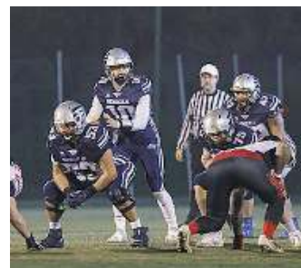
Match. Bengals in azione

che non possiamo prendere sottogamba - è la presentazione della sfida di coach Maggini - i Redskins sono una squadra in crescita e nonostante tre vittorie, non possiamo illuderci di aver già svolto il compito. Il nostro è un organico forte e potente contare su una nuova partita casalinga, non vediamo l'ora di disputare una bella prestazione davanti al nostro pubblico che, anche questa volta, sono sicuro ci seguirà con la passione e il calore che ha sempre dimostrato». // A. D.