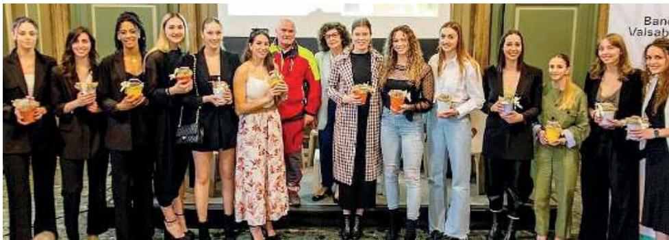
Una giornata speciale. Quella vissuta ieri al Mo.Ca da tutti i protagonisti