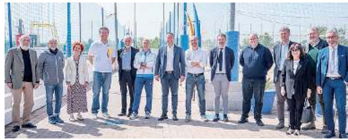
La presentazione. In tanti ieri presenti a Cellatica