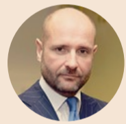
MATTEO TIRABOSCHI Presidente esecutivo del gruppo Brembo

Gft Italia chiude il 2022 con una forte crescita dei ricavi: +29% a 730,14 milioni di euro. La guidance per il 2023 vede una crescita destinata a continuare: previsti ricavi a 850 milioni di euro, EBIT rettificato a 80 milioni di euro e EBT a 72 milioni di euro. Il consiglio di amministrazione ha proposto un aumento del dividendo del 29% a 0,45 euro per azione.