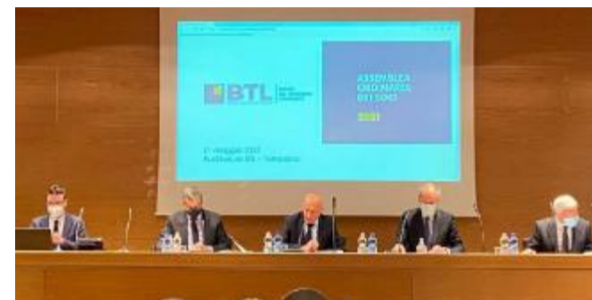
Una fase dell'assemblea della Banca del Territorio Lombardo

«Consolidato il radicamento con maggiori prodotti e servizi»