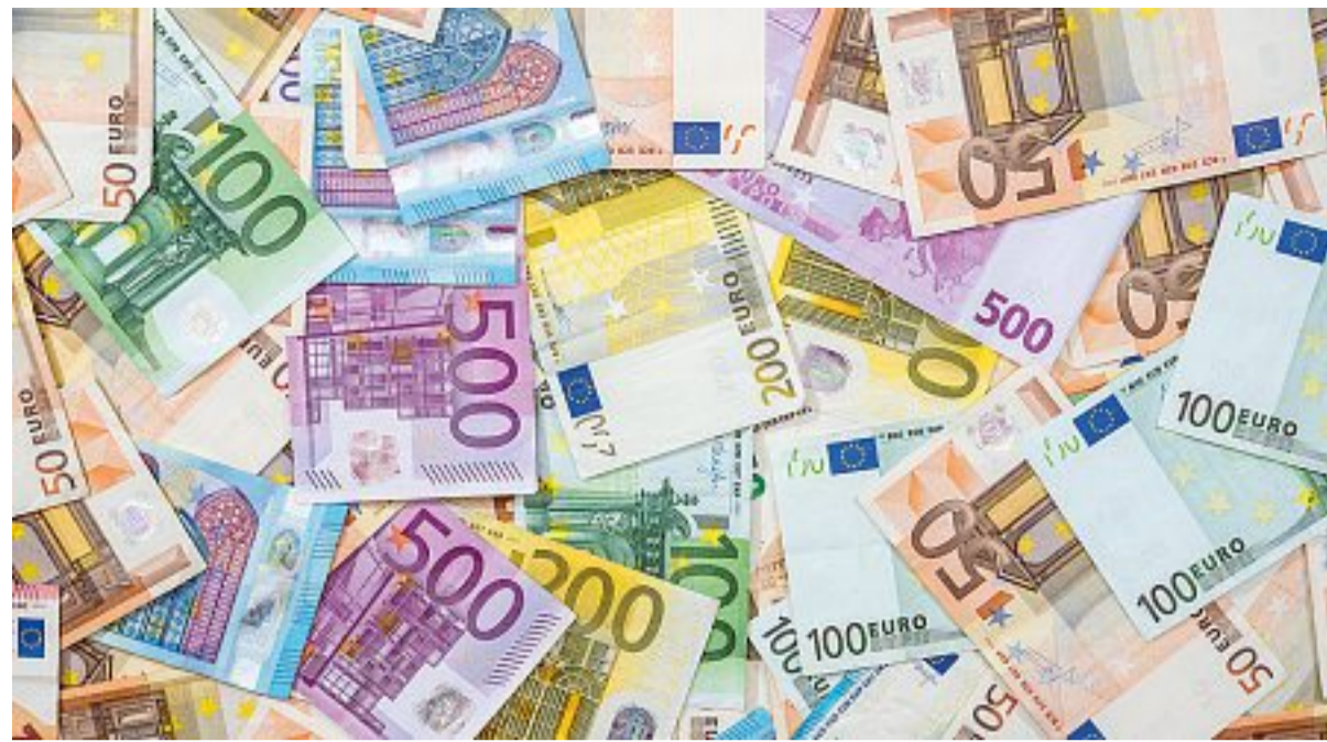
Risparmi In crescita i depositi bancari dei bresciani: in media 21 mila euro investiti in banca

E Brescia è a metà strada, tra le province italiane, nella classifica dei territori più «risparmiosi» dei primi otto